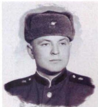
"Нам на двоих с тобою 35"...1963г.