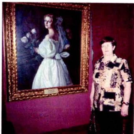
В Московской Государственной картинной галерее А.Шилова