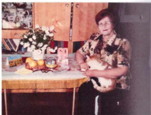
Дома 11 октября 2006г.