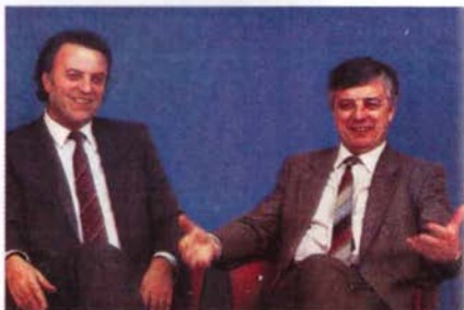
Илья Резник, поэт и Раймонд Паулс, композитор