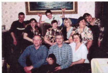
В Санкт-Петербурге среди племянников 2006г.