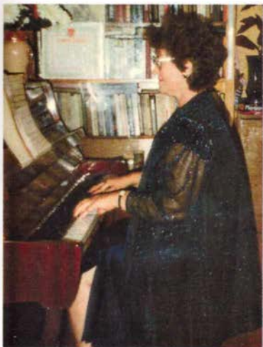
Я за фортепиано