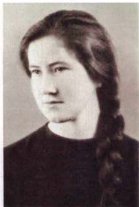
Мне 16 лет