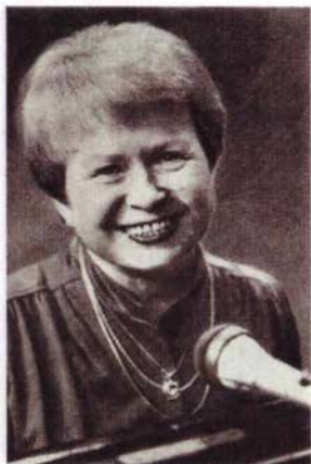
Александра Пахмутова, композитор