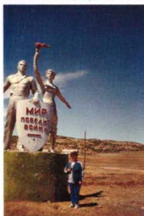
В Каркаралинске. 1996г.