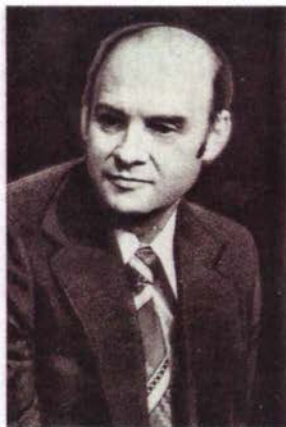
Николай Добронравов, поэт