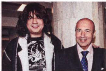
Филипп Киркоров, артист и Игорь Крутой, композитор