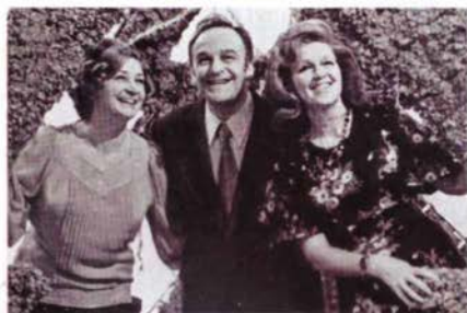
Телеведущие А.Шилова, И.Кирилов, В.Леонтьева