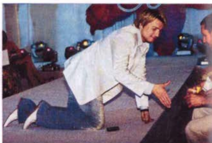
Николай Басков, артист