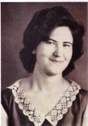
Мне 21 год