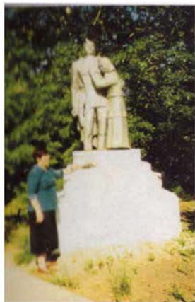
Я в местах своего детства на Кустанайщине 2005г.