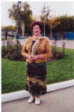
Мне 59 лет