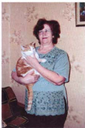
Я с котом Персиком