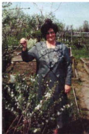
На дачном участке