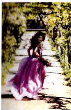
Дочь Наташа 23 года