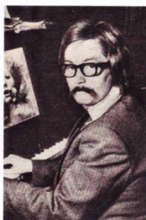
Одна из мистификаций А.Пугачёвой "Композитор Б.Горбунос" 1977г.