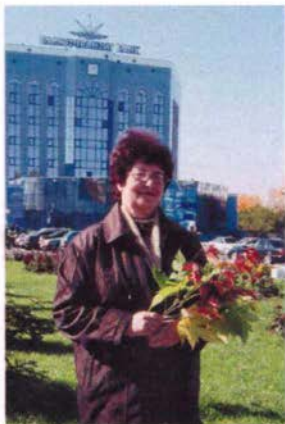
Мне 58 лет