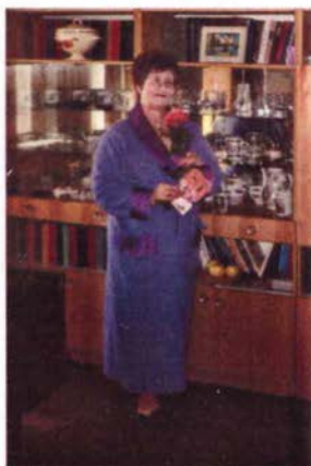
мне 60 лет