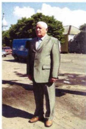
"Нам давно уже не 25"...