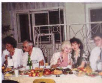
Выпускной вечер в сш №46, 19