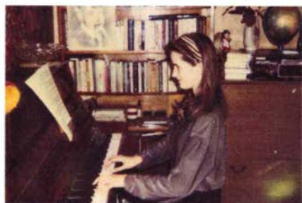
Дочь Наташа за фортепиано