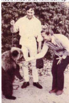
В Высоцкий и М Влади на Кавказе, п.Джубга. 1971г.