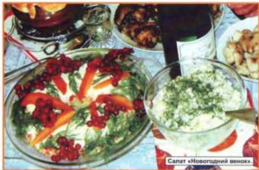
Салат «Новогодний венок».