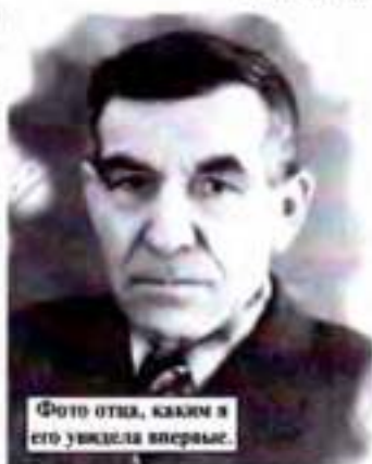
Фото отца, каким я его увидела впервые.