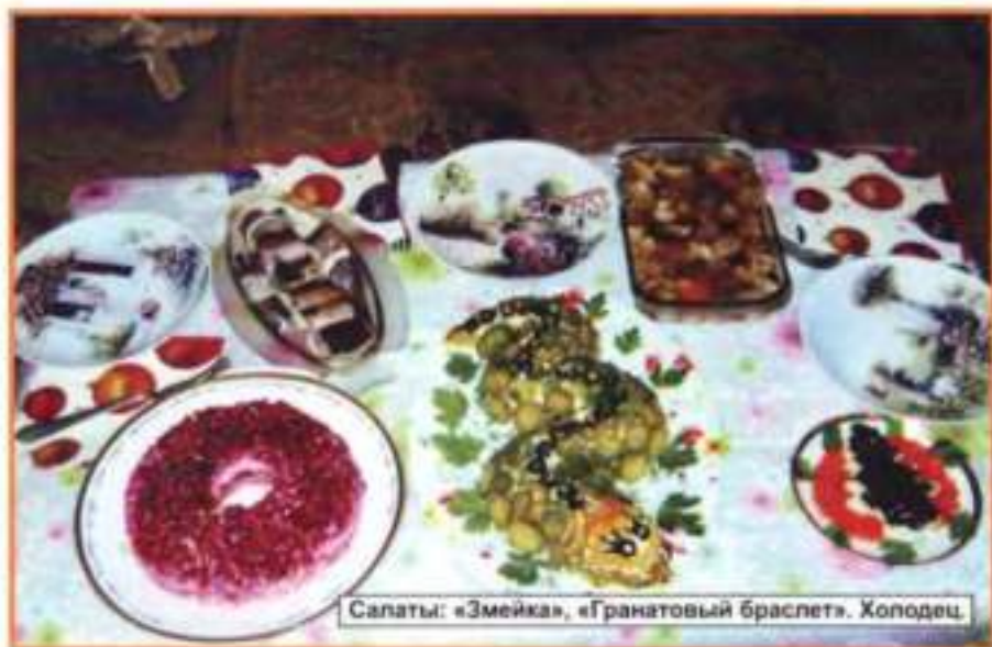
Салаты: «Змейка», «Гранатовый браслет», Холодец.