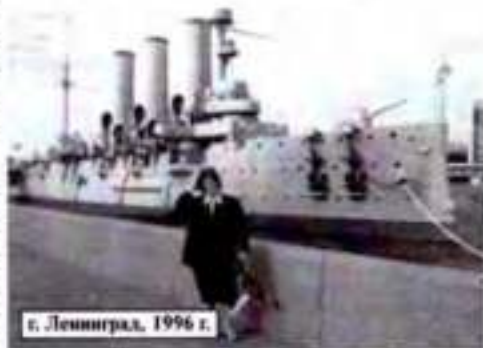
г. Ленинград, 1996 г.

Москва с ее Красной площадью, театрами, музеями, концертным залом "Россия", Мавзолеем, Петергоф со своими фонтанами, Пятигорск с источниками минеральных вод, Ровно с домом-музеем Кузнецова, Алма-Ата с катком "Медведь", Киев с Крещатиком, цветущими каштанами, рекой Днепр, Сестрорецк с Ленинскими местами, Пушкин с Екатерининским дворцом, Кронштадт с Никольским собором, Павловск с парком, Анапа, Геленджик, Сочи с Черным морем, разно-