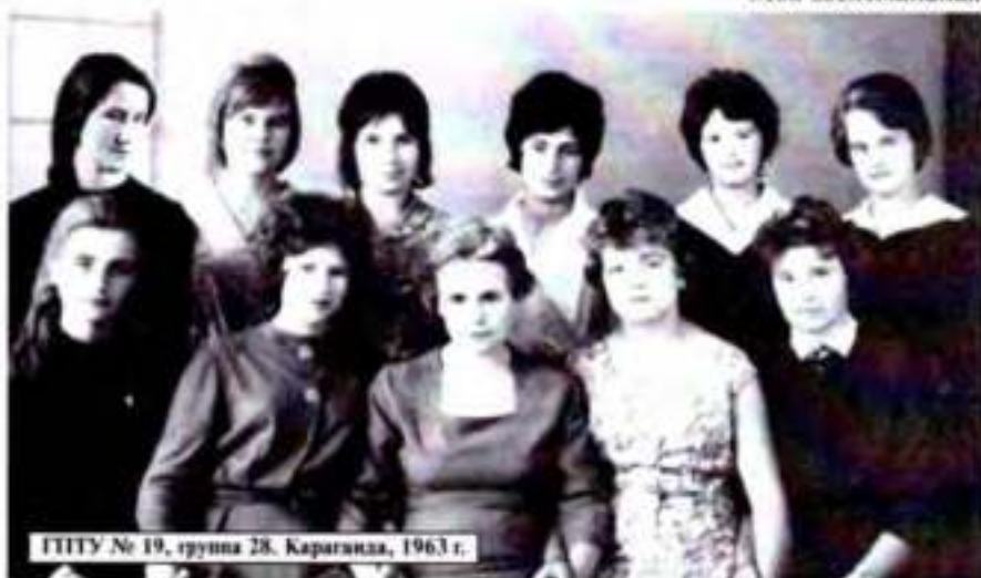
ГПТУ № 19, группа 28, Караганда, 1963 г.

швен. В то время в Караганде ГПТУ №19 выпускало из своих стен специалистов по мужской и женской верхней одежде. Я его успешно закончила, поработала три года, а потом переквалифицировалась, закончив другое учебное заведение, получив специальность бухгалтера банковской системы.