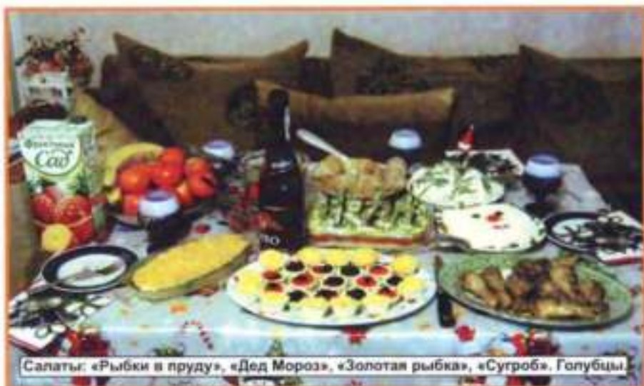
Салаты: «Рыбки в пруду», «Дед Мороз», «Золотая рыбка», «Сугроб», Голубцы.