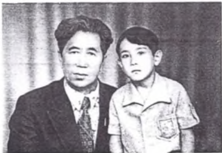
Арнұр алтыға келгенде.