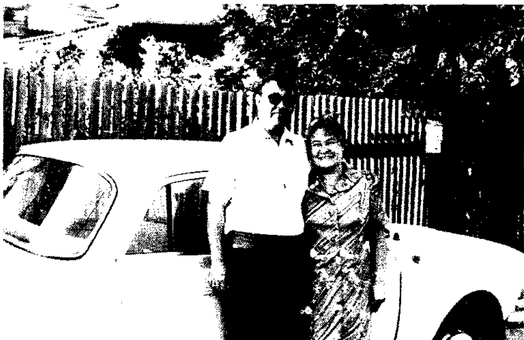
Встречи с мамой в городе Сатпаеве - всегда радость. 1986 год.