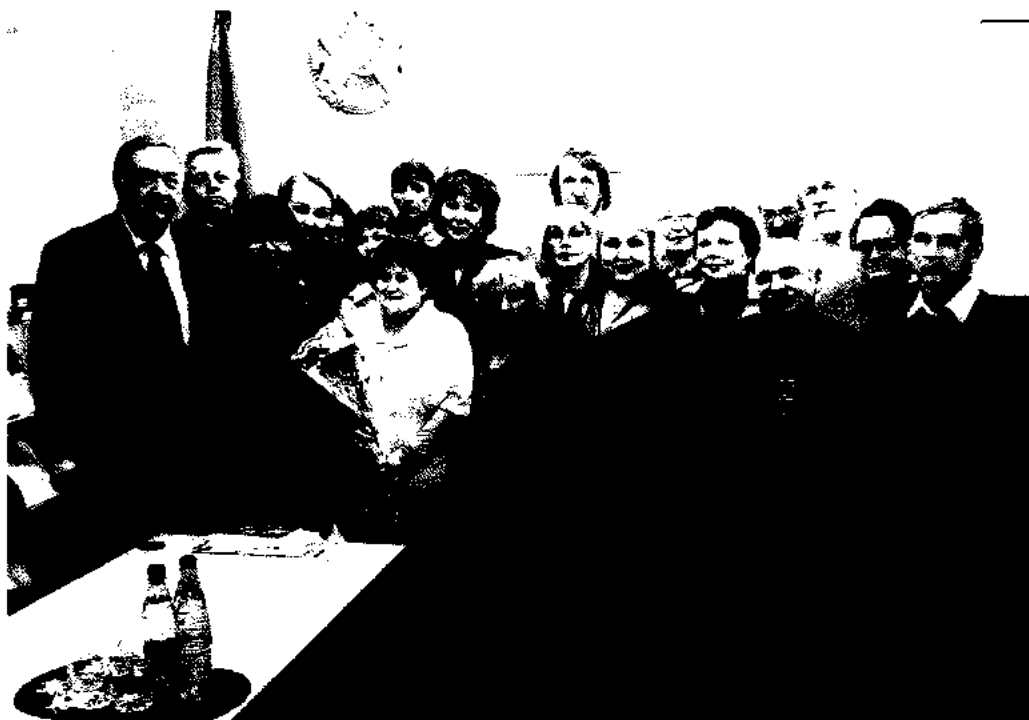
В областной библиотеке имени Гоголя на литературной встрече «Поэзия мужества».