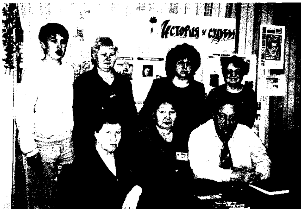
В Пришахтинской библиотеке юношества на творческой встрече, посвященной Дню памяти жертв политических репрессий