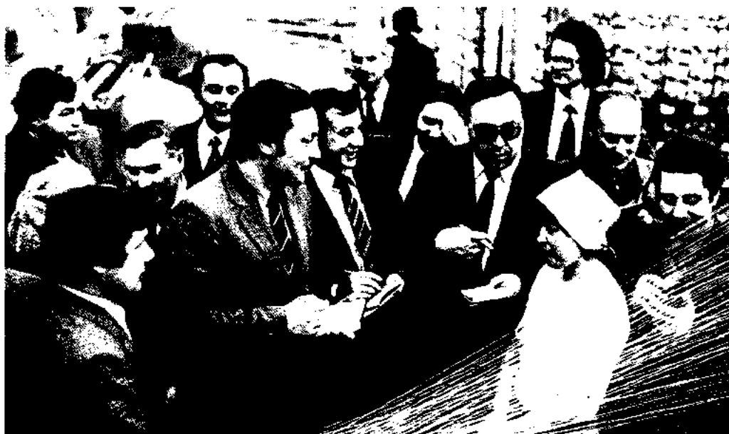
В Алма-Ате на хлопчатобумажном комбинате с коллегами. 1985 год.