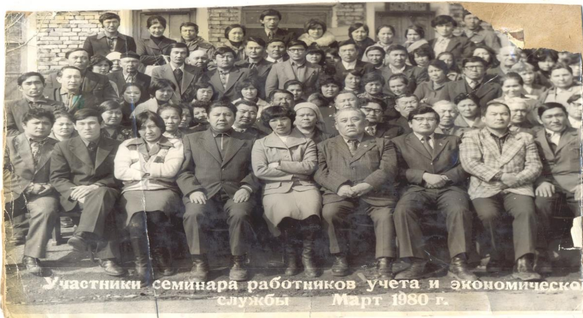
Участники семинара работников учета и экономической службы Март 1980 г.