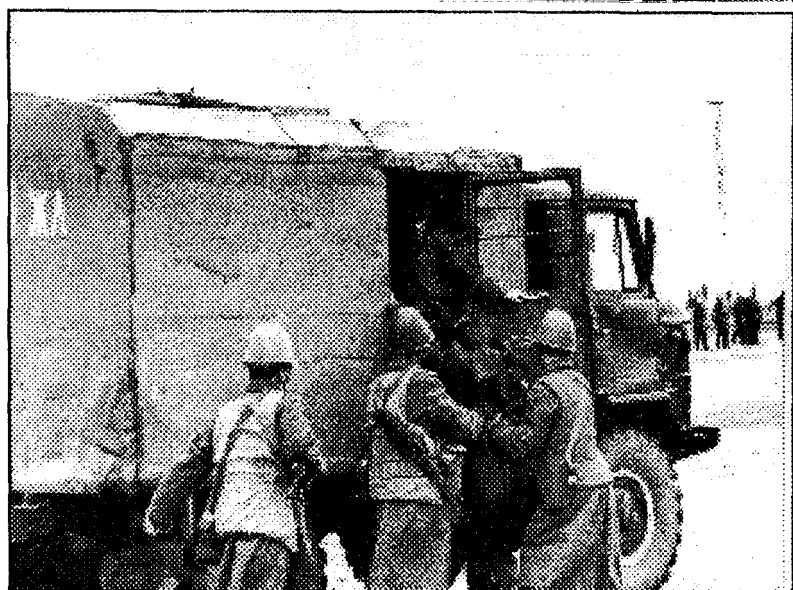
Эпизоды из учений