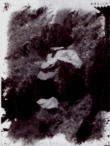
Ғасырлар сүрлеуінде суы сарқылмаған «Керней бабаның әулие бұлағы»