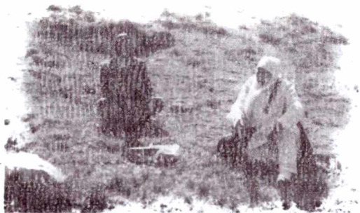
«Керней бабаның әулие бұлағы» жөнінде бір үзік сыр...