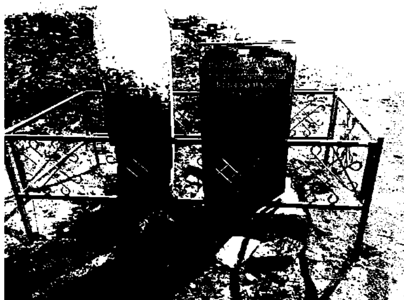
Аймағанбет қажы қорымы