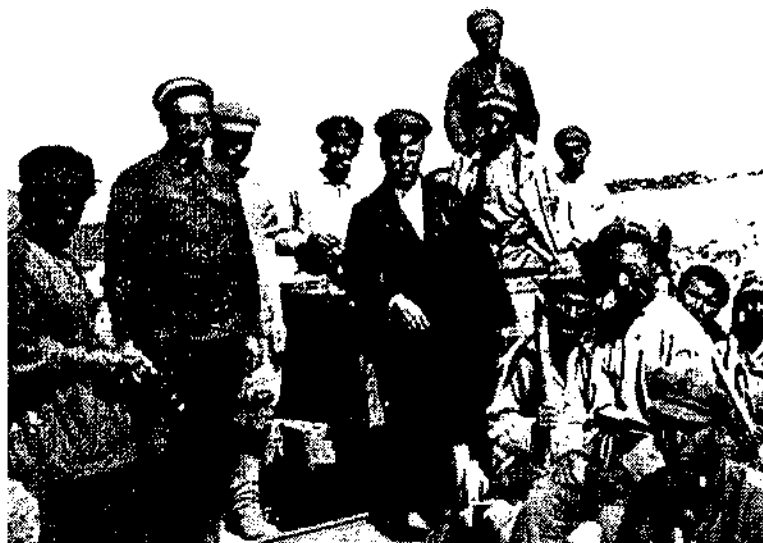
Семізбұғы кеншінің кеншілері, 1928 ж.

Адамды аштықтан, жұртты жоқтықтан, жер-жаһанды жауыздықтан қорғап қалады».