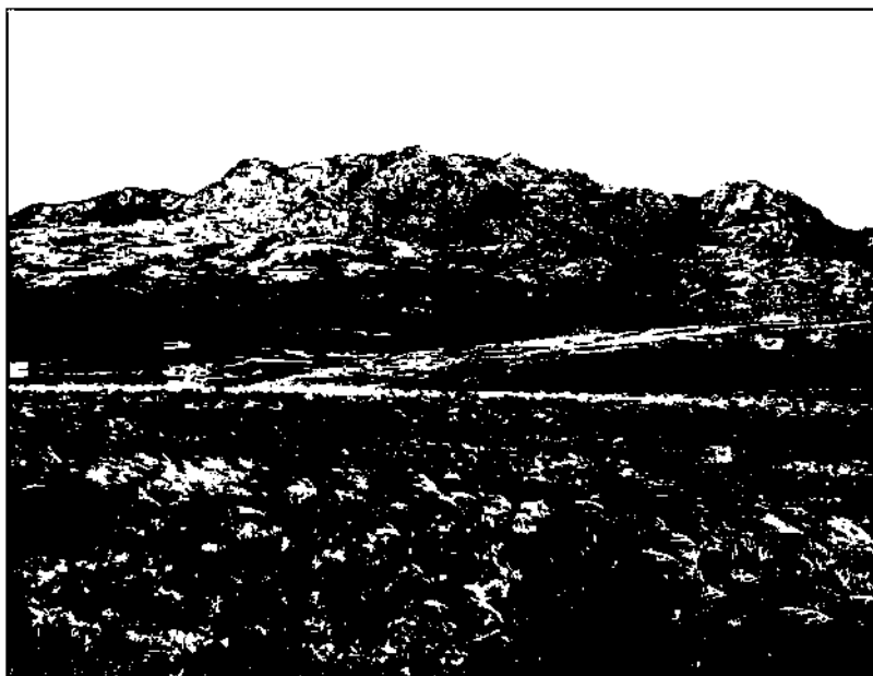
Кенжеәлінің кара тасы