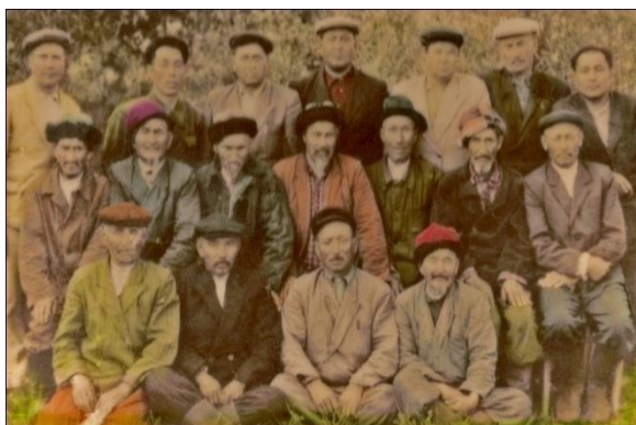
Кенді Семізбұғының бір топ белсенділері (1926-1975 жылдар)